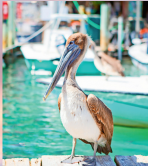
Pelikan i Key West.